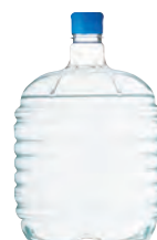
サーバーボトル 12L × 2本 3,700円 (税別)