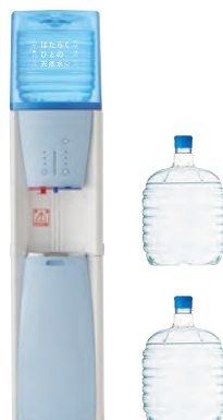
ウォーターサーバー 定期購入 サーバーレンタル料 無料