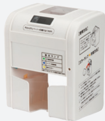
ラク・ロール WH ホワイト樹脂カバー

・市販の家庭用トイレトペーパーであれば芯有り、芯無しどちらでも使用できます。(シングル、ダブル、トリプル、エンボス有り・無し、いずれも対応可) ・付属部品: AC100V(50/60Hz)、コード長さ1.8m ・トイレブース取付用のはさみ込みプレートを別途で用意しています。