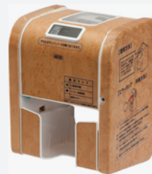
ラク・ロール WD-M 木製カバー メープル

□サイズ:高さ263×幅186×奥行173mm □材料:ABS樹脂・SUS304 □重量:2.1kg □価格:88,000円/個 □入数:30 品番:127-646