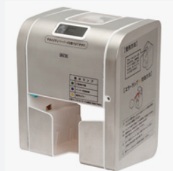
ラク・ロール SU SUSカバー(ステンレスカバー)

□サイズ:高さ263×幅186×奥行173mm □材料:ABS樹脂 □重量:1.3kg □価格:60,000円/個 □入数:1 品番:127-645