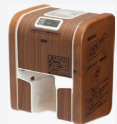
ラク・ロール WD-W 木製カバー ウォールナット

□サイズ:高さ263×幅188×奥行173mm □材料:ABS樹脂・天然木 □重量:1.8kg □価格:95,000円/個 □入数:15 品番:127-647