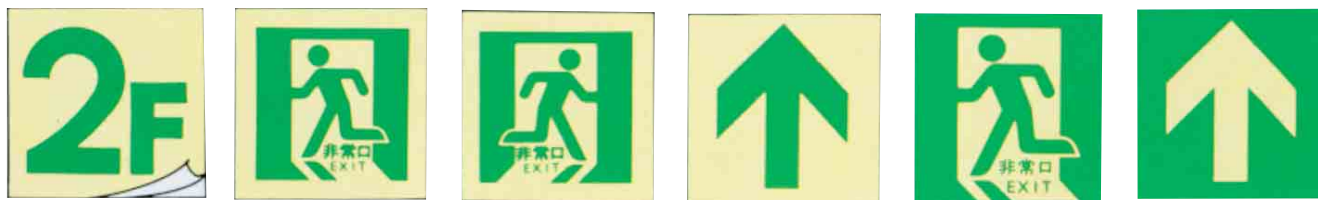
床F-1(B 1 ~9F)